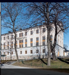
KASERN II, SKEPPSHOLMEN