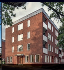
KV DREVKARLEN 9