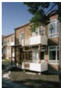
1997. Hökmosseskolan, Dymlingegränd, Hägerstensåsen.