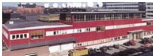
1995. TV4-huset, Tegelluddsvägen, Gärdet.