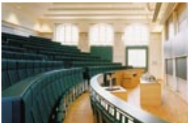
1996. KTH:s huvudbyggnad.