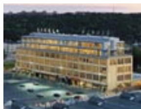
2001. Kv. Luftverkstaden, Sickla.