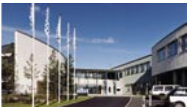
1999. Veddesta 2:79, Järfälla.