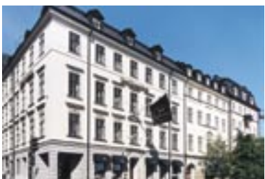
2000. Kvarteret Överkikaren 34, Stockholm.