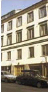
1993. Grev Turegatan 24, Östermalm.