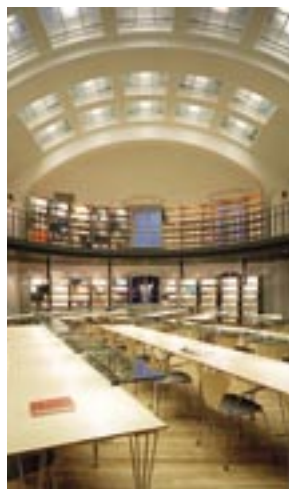
2002. KTH:s bibliotek.

Numreringen av ROT-priset har ändrats, så att årtalet anger det innevarande året istället för, som tidigare, det år då ombyggnaden slutfördes. Därför har år 1998 »hoppats över«.