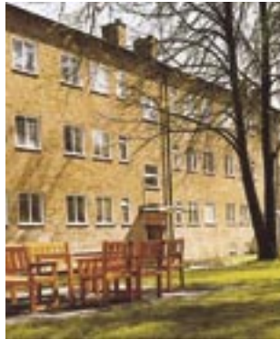
1994. Kvarteret Fjärdingsmannen, Enskedev. 102-106, Enskede.