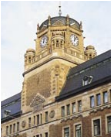
1992. Centralposthuset, Vasagatan.

ROT-priset har delats ut sedan 1991. Följande fastigheter har vunnit priset: