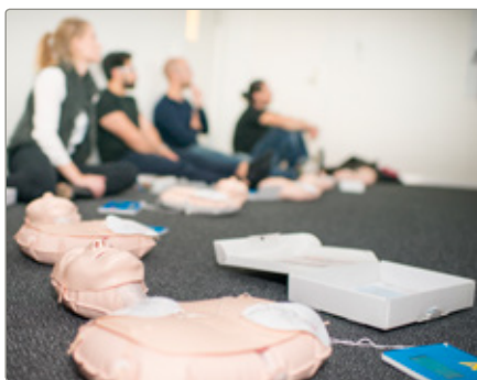
Alla som går Stockholms Byggmästareförenings kurs i hjärt- och lungräddning får utbildningen registrerad i kompetensdatabasen, om man lämnat sitt samtycke.

För att underlätta för företag i hanteringen av utbildningsbevis har ID06 nyligen lanserat Kompetensdatabasen. Syftet är att utbildningsbevis ska kunna registreras i databasen och därmed kopplas till ID06-kortet. Med Kompetensdatabasen minskar risken att utbildningsbevis försvinner eller tappas bort. Det är lätt att få ut en förteckning på samtliga utbildningar för medarbetare och inom en snar framtid även för företag.