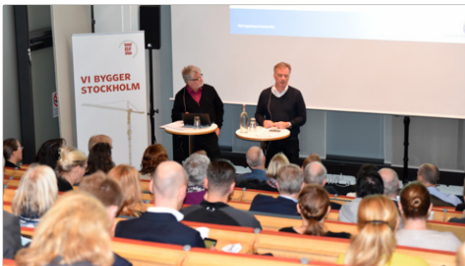
Regeringens samordnare presenterar sitt uppdrag.