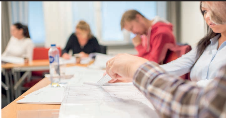
Stockholms Byggmästareförening erbjuder ett fyrtiotal kurser inom olika områden.